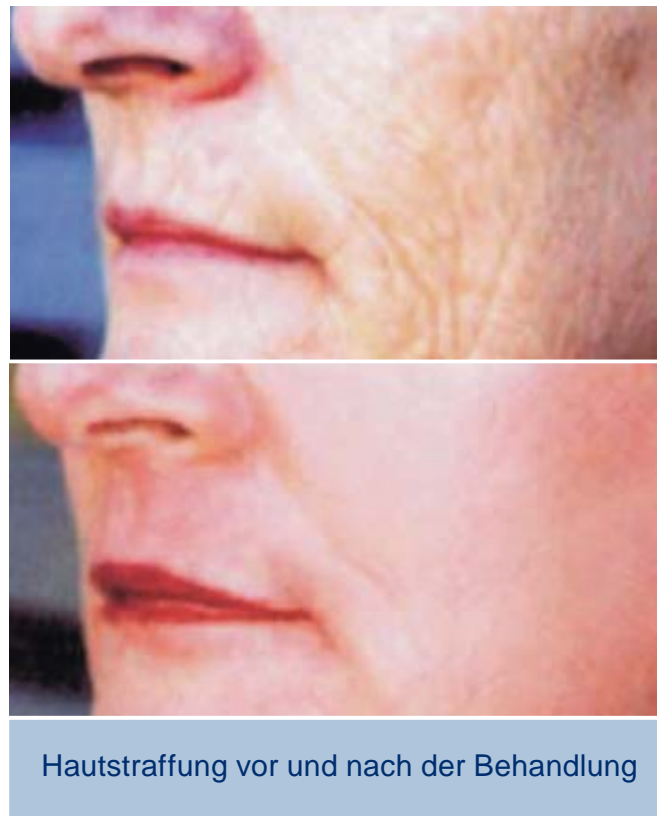
Hautstraffung vor und nach der Behandlung

Der nach der Laserbehandlung entstehende Schorf darf nicht abgekratzt werden. Behandelte Bereiche ca. 6 Wochen nach der Behandlung vor direkter Sonneneinstrahlung schützen, ggf. Sonnenblocker auftragen.