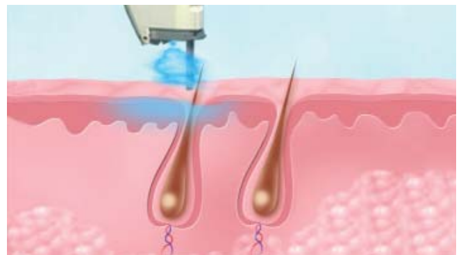
Die Haut wird während der Behandlung durch die dynamische Kühlung geschützt.

Diese Beschwerden klingen innerhalb weniger Sekunden nach der Behandlung ab und werden durch das patentierte DCD-Kühlsystem minimiert. Auf Wunsch kann die Haut auch örtlich betäubt werden.