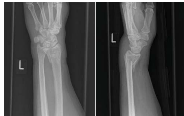
Röntgenbilder eines Speichenbruchs

Bei starken Schmerzen werden Schmerzmittel verabreicht. Wenn eine Schwellung aufgetreten ist, muss der verletzte Arm hochgelagert werden und das Kühlen mit Eis ist sinnvoll. Abhängig vom Behandlungsverfahren (nur bei Ruhigstellung, Einrichten oder operativer Stabilisierung) sind im Verlauf Röntgenkontrollaufnahmen erforderlich.