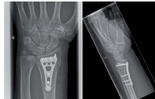
Implantate zur Fixierung des Speichenbruchs

Stehen die Bruchenden durch die Haut sichtbar hervor (offene Fraktur), besteht erhöhte Infektionsgefahr. Meist wird dann ein Antibiotikum (Bakterien abtötendes Medikament) gegeben. Auch nach der operativen Freilegung kann es zum Auftreten einer Entzündung kommen. Lassen sich Fehlstellungen oder kleine Stufen in der Gelenkfläche nicht ausreichend gut beseitigen, kann eine Bewegungseinschränkung oder eine Arthrose auftreten.