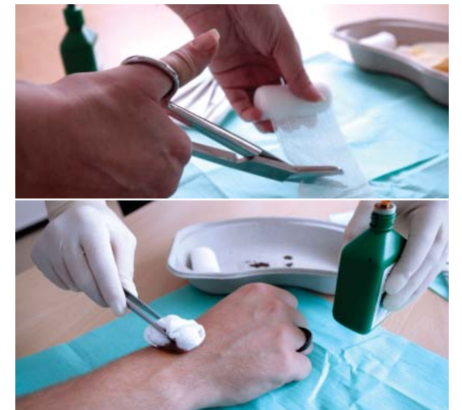
Anlegen bzw. Wechseln des Verbandes nach der Operation

In den meisten Fällen, insbesondere bei den stabilen Frakturen, heilen Handgelenkbrüche folgenlos aus. Nach einigen Wochen können die gewohnten Tätigkeiten zumeist wieder ausgeführt werden. Falls eine andere Erkrankung, z. B. Gangunsicherheit oder Schwindel, zum Sturz geführt hat, ist eine weitere Abklärung und zusätzliche Behandlung erforderlich.